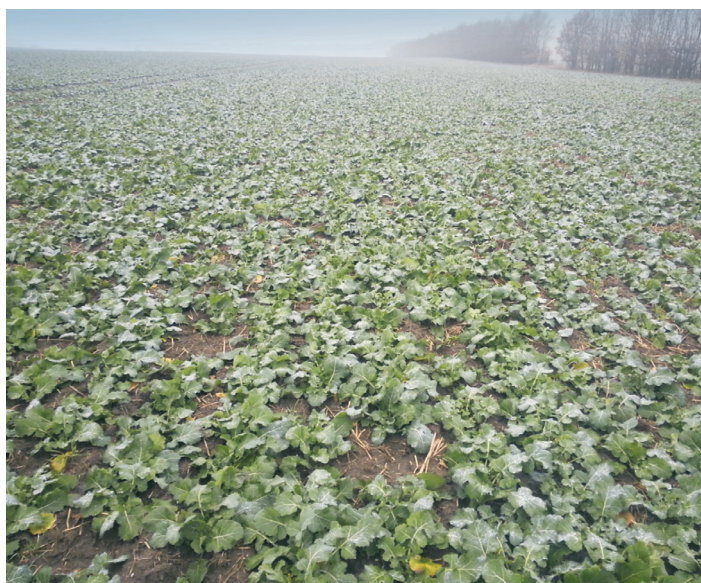
Ein ausreichend entwickelter Rapsbestand mit acht Blättern und einem Wurzelhalsdurchmesser von 10 mm im Herbst 2015. Die N-Aufnahme beträgt 61 kg/ha. Dies bedeutet eine N-Düngeinsparung von 8 kg/ha im Frühjahr.

Im Auftrag des Niedersächsischen Landesbetriebes für Wasserwirtschaft, Küsten- und Naturschutz (NLWKN) führt das Büro INGUS seit 2010 die Grundwasserschutz-Beratung in den Wasserrahmenrichtlinien-(WRRL)-Gebieten Mittlere Weser und Mittlere Elbe durch. Seit 2012 wird im Gebiet Mittlere Elbe die N-Aufnahme im Herbst auf allen Rapschlägen der WRRL-Betriebe ermittelt. Die Ergebnisse sprechen für sich. Für den Grundwasserschutz hat junger Winterraps vor Winter häufig eine ähnlich gute Herbst-Nmin-reduzierende Wirkung wie Zwischenfrüchte. Dagegen liegen die Herbst-Nmin-Werte im Boden nach der Rapsernte deutlich höher, häufig über 80 kg/ha, da die Kornernte nur geringe N-Mengen abfährt.